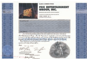
Nr. 1168 Schätzpreis: 200,00 EUR Startpreis: 90,00 EUR