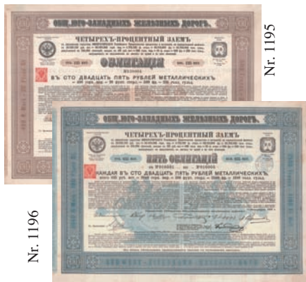
Nr. 1195 Schätzpreis: 50,00 EUR Startpreis: 25,00 EUR