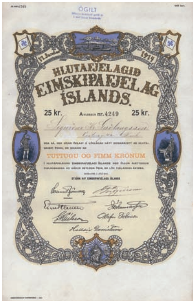
Nr. 1221 Schätzpreis: 400,00 EUR Startpreis: 200,00 EUR Hlutafjelagid Eimskipafjelag Islands

Aktie 25 Kr., Nr. 11972 Reykjavik, 30.11.1917 EF/VF Die 1914 gegründete Gesellschaft unterhielt Dampferlinien zwischen Island und den Niederlanden (die Linie Reykjavik-Rotterdam wird von ihr noch heute befahren). Hochdekorativer Schiffahrtswert, schmuckvolle Umrandung mit Wikinger-Flagge (umgekehrtes Hakenkreuz) und vier blau unterlegten Vignetten mit Dampfschiff und Wikinger-Legenden. Wikinger oder Normannen nannte man die skandinavischen Germanen, die im 8. bis 11. Jh. als Seeräuber ganz Europa bis nach Italien brandschatzten. Norwegische Normannen waren es, die Island besiedelten und von hier aus Grönland und Nordamerika entdeckten. Nur 12 Stück wurden Anfang 2003 in Holland gefunden. Mittelknickfalte. (Einlieferer-Nr.: 64)