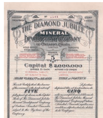
Nr. 1236 (Ausschnitt)

VF+ Die Gründung der Pacific Whaling Company (der späteren Canadian North Pacific Fisheries) im Jahr 1905 markiert den Beginn des kommerziellen Walfangs im Nordpazifik. Zuvor hatten die Initiatoren Captain Sprott Balcom und Captain William Grant mit ihren Schiffen Pelzrobber gejagt. Nachdem diese fast ausgerottet waren, wandte man sich dem Walfang zu. Auf Inselgruppen vor der Küste von British Columbia wurden fünf feste Walfangstationen errichtet. Ein drastischer Rückgang der Fänge im Jahr 1914 führte 1915 zum Konkurs dieser Gesellschaft. Die Fangstationen und Walfangschiffe kaufte der Amerikaner William P. Schupp, dem bereits zwei Walfangstationen vor der Küste von Alaska und eine im Staat Washington gehörten. Schupp formte daraus die "Consolidated Whaling Corporations Ltd." Vor der Küste von British Columbia wurden bis zur Einstellung des Walfangs im Jahr 1967 insgesamt 24.427 Wale erlegt. Herrlicher Stahlstich von Waterlow & Sons mit großer Walfangszene. Maße: 21,5 x 28,4 cm.