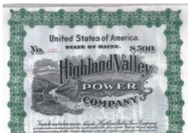
Nr. 1443 (Ausschnitt)

1 share à 0,01 $, Nr. 1441223 14.5.2002 EF Gültige Aktie! Gründung am 1.1.1939 von William (Bill) Hewlett und David Packard als Hersteller wissenschaftlicher Instrumente in einer Garage in Palo Alto, Kalifornien. Diese Garage gilt als Geburtsort des Silicon Valley. Seither ist HP bekannt für eine große Anzahl verschiedener Produkte, u.a. Drucker, Taschenrechner, Messinstrumente, Computer, Digitalkameras. 2002 fusionierte HP mit Compaq. Sehr dekorativ mit zwei allegorischen Gestalten.