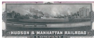
Nr. 1448 (Ausschnitt)

13 shares à 100 $, Nr. 10271 EF 18.12.1903 Gegründet 1877 mit juristischem Sitz in Californien, heute einer der größten Bergbau-Konzerne der USA. Die Silberminen liegen im Black Hills District, South Dakota. 1899 wurde die Highland Mining Co. und die Black Hills Canal & Water Co. übernommen. Homestake besaß 476 claims sowie riesige Erzaufbereitungs-, Hütten- und Kraftwerke bei Lead im Lawrence County. Blau/schwarzer Stahlstich, tolle große Vignette mit in die Ebene spähenden Indianern.