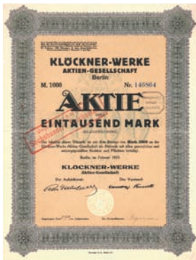
Nr. 581 Schätzpreis: 350,00 EUR Startpreis: 120,00 EUR

Namens-Aktie 1.000 RM, Nr. 409 Wolmirstedt, 25.2.1929 EF Auflage 103, weitere 382 in vier Sammelaktien verbrieft (R 7). Gründung 1909. Für den Betrieb der 8,5 km langen Anschlussbahn wurden gerade einmal 9 Mann Personal gebraucht. Den Betrieb führte bis 1945/46 die Kleinbahnabteilung des Provinzialverbandes Sachsen in Merseburg. Dann ging die Bahn über auf die Sächsischen Provinzbahnen GmbH und am 1.4.1949 auf die Deutsche Reichsbahn. Diese stellte den Gesamtverkehr am 31.12.1965 ein und baute die Gleise ab. Prägesiegel lochentwertet.