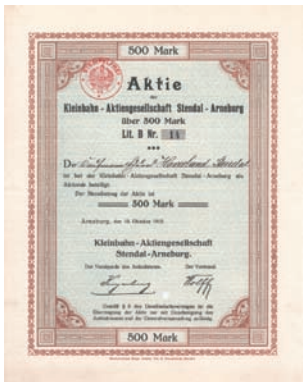
Nr. 579 Schätzpreis: 500,00 EUR Startpreis: 250,00 EUR