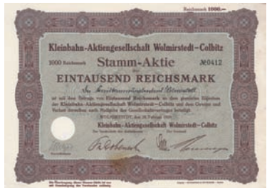
Nr. 580 Schätzpreis: 300,00 EUR Startpreis: 150,00 EUR

Namensaktie Lit. B 500 Mark, Nr. 12 Arneburg, 10.10.1913 EF/VF Kapitalerhöhung für den Umbau auf Normalspur, Auflage 30 (R 8), ausgestellt auf den Drogisten A. Elsässer in Stendal. Gründung 1898 durch den Staat Preußen, die Provinz Sachsen und den Kreis Stendal. 12,6 km lange Bahn von Stendal nach Arneburg, eröffnet 1899 in 1.000-mm-Spur, 1913/14 Umspurung auf Normalspur (1.435 mm). 1924 durch Fusion in der Stendaler Kleinbahn-AG (vorher Kleinbahn-AG Stendal-Arendsee, ab 1942 Stendaler Eisenbahn-AG) aufgegangen. 1946 Enteignung und Übernahme durch die Sächsische Provinzbahnen GmbH, 1948 vom VVB des Verkehrswesens Sachsen-Anhalt übernommen, ab 1.4.1949 gehörte die Stendaler Eisenbahn zur Deutschen Reichsbahn. Die Strecke Stendal-Arneburg wurde 1972 für den Gesamtverkehr stillgelegt, aber nicht für immer: Ein Teil der Trasse wurde ab 3.1.1977 für die Strecke Borstel-Niedergörne benutzt, die als Anschlussbahn für das nie in Betrieb gegangene Kernkraftwerk Stendal bestimmt war und bis Ende 1995 auch Personenverkehr ab Bahnhof Stendal besaß. Heute ist die Bahn an die Stadt Arneburg verpachtet, sie wird für Holztransporte zur Zellstoff Stendal GmbH in Niedergörne benutzt. Doppelblatt, lochentwertet.