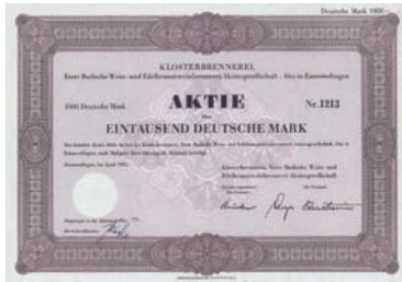
Nr. 584 Schätzpreis: 250,00 EUR Startpreis: 100,00 EUR

Aktie 50 DM, Nr. 36357 Duisburg, Juli 1987 EF+ Dekorativ, mit großem Portrait von Peter Klöckner. Prägesiegel lochentwertet.