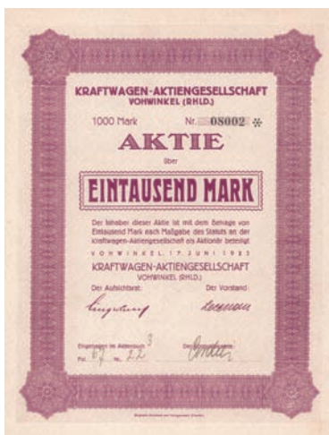
Nr. 596 (39 Stücke)

Rheinfelden (Baden), Mai 1961 EF+ Aktienneudruck, Auflage 42000. Prägiesiegel lochentwertet.