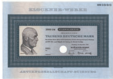
Nr. 582 Schätzpreis: 100,00 EUR Startpreis: 50,00 EUR