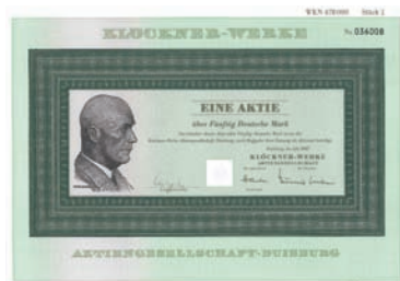
Nr. 583 Schätzpreis: 100,00 EUR Startpreis: 50,00 EUR

Globalaktie 10 x 100 DM, Blankette Duisburg, Dezember 1960 EF Dekorativ, mit großem Portrait von Peter Klöckner.