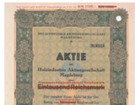
Nr. 529 (Ausschnitt)

Aktie 100 RM, Nr. 136 Sebnitz, Juli 1938 EF+ Auflage 50 (R 7). Gründung 1922 als Holz- und Kartonagenindustrie, ab 1938 Holz- u. Kartonagenindustrie-Garagen-AG. Herstellung von und Handel mit allen Waren, die mit Holz oder Pappe in Verbindung stehen, Betrieb einer Großgarage. Unterhaltung von Tankstellen, Handel mit Autoölen, Fetten und Reifen. 1995 aufgelöst. Lochentwertet.