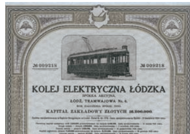
Nr. 1261 (Ausschnitt)

Staates gestellt. Nach einem Brand 1964 wurde die Fabrik neu gebaut und erlebte ab da einen lebhaften Aufschwung. Hochdekorativer polnischer Porzellan-Titel, links Putte beim Bemalen einer Vase, rechts Offizier und Löwe. Mit anh. restlichen Kupons ab 1924.