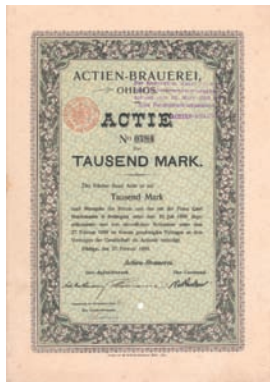
Nr. 76 Schätzpreis: 225,00 EUR Startpreis: 100,00 EUR

Aktie 100 DM, Nr. 10752 Bad Salzschlirf, Dezember 1964 EF Auflage 3.000 (R 8). Die 1900 gegründete AG übernahm das seit 1838 bestehende Bad Salzschlirf mit Quellen und Bergwerksrechten (Kur- und Hotelbetrieb mit Theaterhalle und Musiktempel, Abfüllung des Wassers aus dem Bonifaziusbrunnen). Die drei gesellschaftseigenen Hotels Badhof, Kurhaus und Großes Gartenhaus wurden 1939 für Lazarettzwecke beschlagnahmt und erst ab 1949/50 zu den alten Zwecken wieder eröffnet. Die Krise des deutschen Gesundheitswesens zwang die im Frankfurter Telefonverkehr notierte AG 2002 in die Knie, aus dem Börsenmantel wurde die heute im Unternehmenssanierungsgeschäft erfolgreiche Arques AG. Großes Signet mit einer Schlange in perlendem Wasser. Prägeseigel lochentwertet.