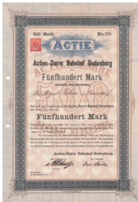
Nr. 77 Schätzpreis: 750,00 EUR Startpreis: 375,00 EUR

Actie Lit. A 1.000 Mark, Nr. 77 Minden, 25.3.1898 VF Auflage 300 (R 7). 1865 Gründung der Brauerei Brettholz & Denkmann. AG seit 1888. 1918 Ankauf der Mindener Stiftsbrauerei, 1922 Erwerb des Braukontingents der Kronenbrauerei Bückeburg. 1924 Ankauf der Stadt. Brauerei Hempel & Co. in Stadthagen. Neben verschiedenen Wirtschaftsanhängen gehörte der Gesellschaft auch die Tonhalle in Minden. Die Aktien notierten seit 1890 bei äußerst sporadischen Umsätzen an der Börse Hannover, später im ungeregelten Freiverkehr Düsseldorf. Großaktionär war zuletzt mit über 98 % die Berliner Schultheiss-Brauerei AG. 1978 auf die Dortmunder Union-Schultheiss-Brauerei AG (1988 umbenannt in Brau und Brunnen AG, seit 2004 Teil der Radeberger Gruppe) verschmolzen. Originalunterschriften. Doppelblatt, lochentwertet.