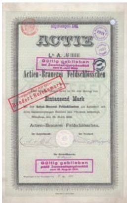
Nr. 75 Schätzpreis: 500,00 EUR Startpreis: 200,00 EUR