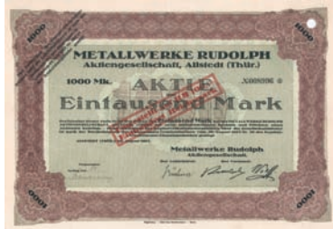
Nr. 588 Schätzpreis: 350,00 EUR Startpreis: 150,00 EUR

bahn, 1894 Fusion mit der Blankensee-Woldegk-Strasburger Eisenbahn zur Mecklenburgische Friedrich Wilhelm Eisenbahn. Neben den 83 km langen Hauptlinien auch Betrieb der Hafengebühren in Neustrelitz und Mirow. Zusätzlich gebaut wurde 1910 die 19 km lange Nebenbahn Thurow-Feldberg und 1917 zu militärischen Zwecken ein 10 km langer Abzweig von Mirow zum Müritzsee. Gesamtbahnlänge 112 km in Normalspur. In Buschhof Anschluß an die Prignitzer Eisenbahn, in Strasburg in der Uckermark an die preuß. Staatsbahn. Mit 11 Lokomotiven, 15 Personenwagen und über 100 Güterwagen wurden pro Jahr im Schnitt 1/2 Mio. Passagiere und 1/2 Mio. t Güter befördert. Börsennotiz Berlin. Letzte Großaktionäre waren das Land Mecklenburg (35 %) und die Commerzbank (21 %). In der letzten größeren Verstaatlichungswelle zum 1.1.1941 auf die Deutsche Reichsbahn übergegangen. Doppelblatt, lochentwert.