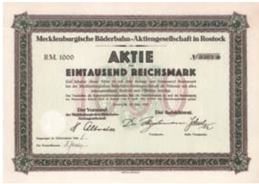
Nr. 585 Schätzpreis: 150,00 EUR Startpreis: 40,00 EUR