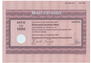
Nr. 590 Schätzpreis: 150,00 EUR Startpreis: 75,00 EUR

Aktie 300 Mark, Nr. 20 Stuttgart, Juni 1923 EF- Auflage 998. Ursprüngliche Gründung 1876 als oHG, ab 1923 AG zur Fortführung des von der Firma Metallwerke vorm. Paul Stotz GmbH betriebenen Geschäfts, das sich mit der Herstellung und dem Vertrieb kunstgewerblicher Metallwaren befasste. 1928 wurde Auflösung beschlossen. Lochentwertet.