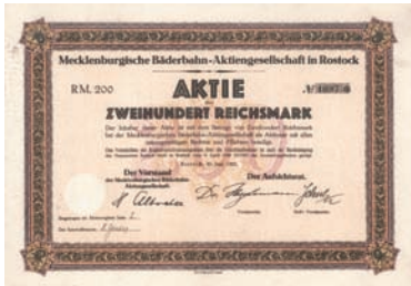
Nr. 586 Schätzpreis: 150,00 EUR Startpreis: 75,00 EUR

Aktie 1.000 RM, Nr. 317 Rostock, 20.6.1925 EF Gründeraktie, Auflage 768. Normalspurige Strecke Rövershagen-Graal-Müritz (10,3 km), Gründer waren die Stadt Rostock, die Gemeinden Graal und Müritz, die Berliner Straßenbahn-Gesellschaft (später BVG) und die Rostocker Kaufmannschaft. Die Bahn beförderte vor allem Sommerfrischler. Lochentwertet.