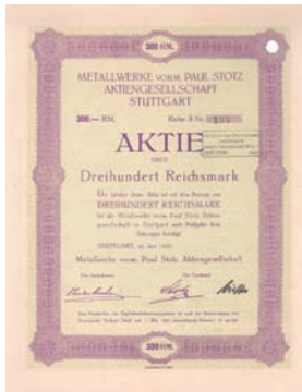
Nr. 589 Schätzpreis: 150,00 EUR Startpreis: 75,00 EUR

Aktie 1.000 Mark, Nr. 8996 Allstedt (Thür.), August 1923 EF/VF Auflage 3.750 (R 11). Begründet 1921 unter Übernahme der seit 1890 bestehenden Metallwerke Rudolph. Herstellung und Vertrieb von Maschinen und Metallwaren aller Art. Lochentwertet. Nur 2 Stücke sind bekannt!