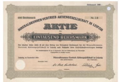
Nr. 591 Schätzpreis: 250,00 EUR Startpreis: 125,00 EUR

Aktie 1.000 DM, Nr. 802382 Bad Überkingen, September 1986 UNC/EF Auflage 2.600 (R 9). Gründung 1923, hervorgegangen aus dem zuvor genossenschaftlichen Kurhaus und Mineralbrunnenbetrieb in Bad Überkingen. Heute mit Produktionsbetrieben in Bad Überkingen, Bad Imnau (Apollo-Quellen), Kisslegg/Allgäu, Waiblingen (Remstal-Quellen), Bad Teinach und Fachingen (Fachinger Heil- und Mineralbrunnen). Außerdem werden Kult-Marken wie Bluna und Afri-Cola produziert. Noch heute börsennotierte AG. Ein Verschmelzungs-Versuch mit der Nestlé-Tochter "Blaue Quellen" schlug 2001 fehl, daraufhin verkaufte Nestlé seine Beteiligung an die saarländische Karlsberg-Brauerei. 2008 erwarb die AG die Tucano Holding mit den Saftmarken Merziger, Niehoffs Vaehinger, Klindworth, Lindavia, Schloss Veldenz und DCide. Produziert werden die Säfte in Lauterecken, Merzig und Sittensen. Rückseitig entwertet.