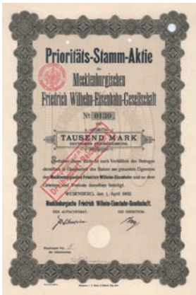
Nr. 587 Schätzpreis: 250,00 EUR Startpreis: 100,00 EUR

Aktie 200 RM, Nr. 1096 Rostock, 20.6.1925 EF/VF Auflage 260 (R 6). Lochentwertet.