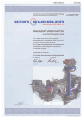
Nr. 540 Schätzpreis: 100,00 EUR Startpreis: 50,00 EUR