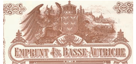
Nr. 1035 (Ausschnitt)

Auflage 1.070, D/H OEL 2516d. Konzessioniert 1912, bekannt als die "Pressburger Bahn". Normalspurige Bahn Wien-Wolfsthal (62 km), heute Teil des ÖBB-Streckennetzes. Doppelblatt, leicht angeschmutzt.