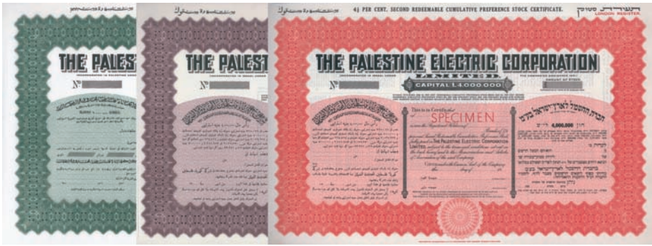
ex Nr. 996

großen Städten Palästinas Kraftwerke und im Norden in Naharajim eine große hydroelektrische Station, die das Wasser der Flüsse Jordan und Yarkon zur Energiegewinnung nutzte. Dem Direktorium der Gesellschaft gehörte außer Rutenberg auch Sir Herbert Samuel (Vors.), Dr. Georg Halpern und J.A. de Rothschild. Während des Unabhängigkeitskrieges zerstörte Jordanien das Kraftwerk. Nach der Gründung des Staates Israel wurde die Gesellschaft nationalisiert und in Israel Electric Corporation umbenannt. Dreisprachig arabisch/englisch/hebräisch. Riesenformat (29,5 x 49 cm). Raritäten aus dem aufgelösten Archiv der Bradbury, Wilkinson & Co.